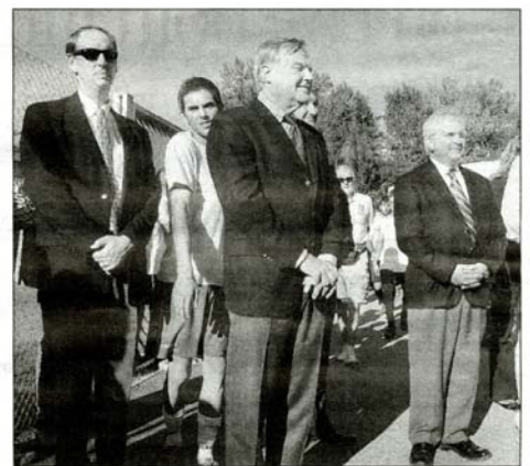
Taglio del nastro Con i vertici della Power One

Protesta alle elementari Vialetto di ingresso disseminato di buche e avvallamenti